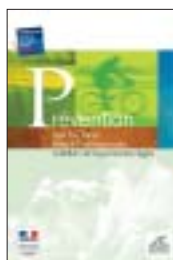
Prévention des fractures liées à l'ostéoporose Nutrition de la personne âgée