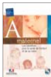
Allaitement maternel Les bénéfices pour la santé de l'enfant et de sa mère

sur le site : www.sante.gouv.fr Thème « nutrition »