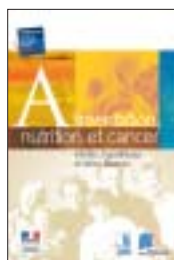
Alimentation, nutrition et cancer Vérités, hypothèses et idées fausses