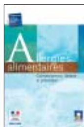
Allergies alimentaires Connaissances, clinique et prévention