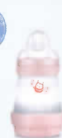
160 ml Tétine débit 1 0+ mois