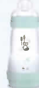
260 ml Tétine débit 2 2+ mois