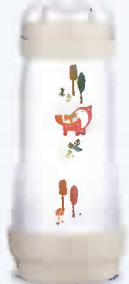
320 ml Tétine débit 3 4+ mois

4 tailles disponibles - plusieurs coloris au choix