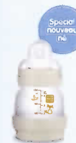
130 ml Tétine débit 0 0 mois